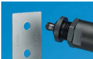
Werkstück mit rundem Bohrloch