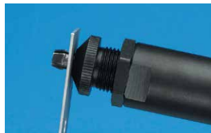
Der auf dem Gerät montierte Stanzaufsatz wird in das runde Bohrloch eingeführt