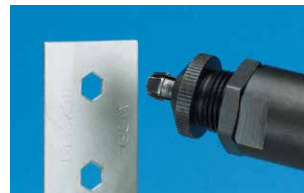
Werkstück mit dem erzeugten Sechskantloch, bereit zur Aufnahme der Hexsert® Blindnietmutter.